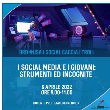
Figura 3: "I social media e i giovani: strumenti ed incognite"