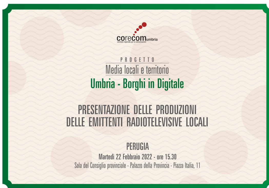
Figura 1: Invito presentazione video "Umbria - Borghi in Digitale"

sono stati presentati nel corso di una iniziativa pubblica e, a conclusione dell'iniziativa, si è tenuta la cerimonia di premiazione, con la consegna degli attestati ai fornitori di servizi audiovisivi e radiofonici dell'Umbria che sono risultati vincitori. All'evento è stata data ampia diffusione, sia attraverso materiale fotografico che video nei profili Instagram (al profilo corecom_umbria) e Facebook (alla pagina Corecom Umbria), sia mediante pubblicazione dei soggetti ammessi al contributo ugualmente nei social e nel sito istituzionale (all'indirizzo www.corecom.umbria.it/media-territorio-edizione-2021-umbria-borghi-in-digitale ).