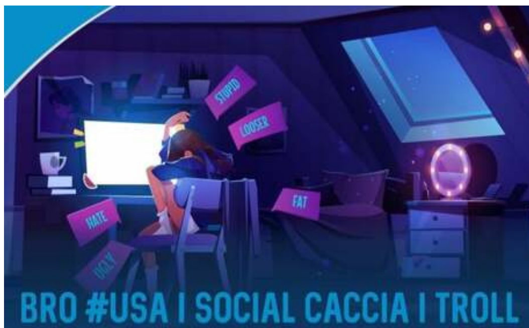
Figura 2: Bro #usa i social caccia i troll