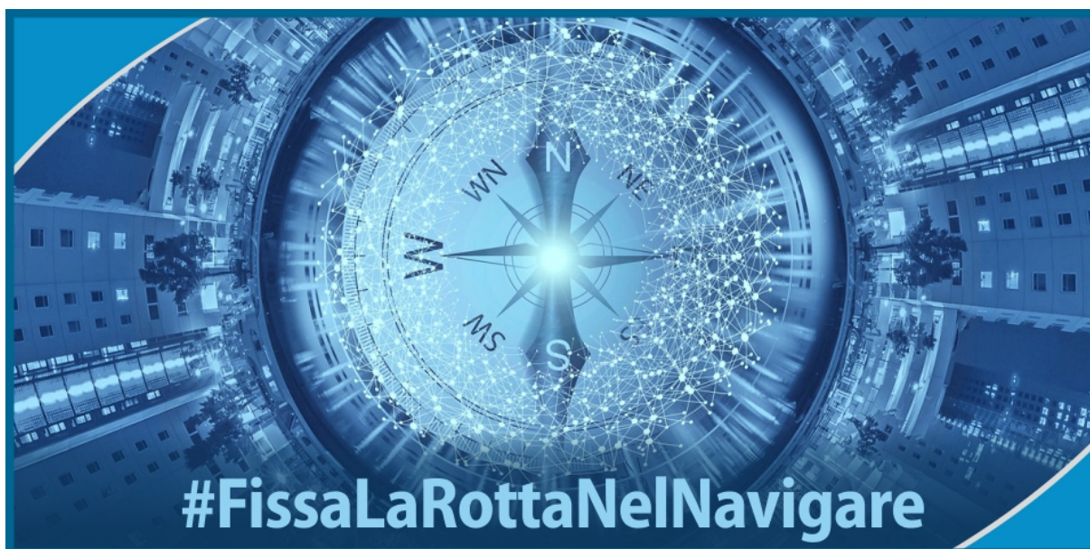
Figura 9: Logo progetto #FissaLaRottaNelNavigare

Nell'anno 2022 è stata stipulato un accordo con l'Università degli Studi di Perugia, in tema "LA RIFORMA DELLA PAR CONDICIO: PLURALISMO POLITICO ISTITUZIONALE SUI NUOVI MEDIA - LE GARANZIE PER IL CITTADINO". In base all'accordo, l'Università svolgerà una ricerca che, prendendo le mosse dall'attuale contesto normativo e giurisprudenziale, si propone, in una prospettiva de iure condito, di fornire un quadro esaustivo dello stato dell'arte in materia, avuto riguardo anche alla disciplina in materia di altri Paesi, nonchè di indagare le potenzialità applicative della disciplina attuale, al fine di adattarla al contesto attuale; successivamente, in una prospettiva de iure condendo, il lavoro si prefigge lo scopo di elaborare una proposta di modifica della normativa vigente, al fine di renderla uno strumento efficace per la realizzazione effettiva del pluralismo politico istituzionale, nell'ottica della tutela e delle garanzie per il cittadino.