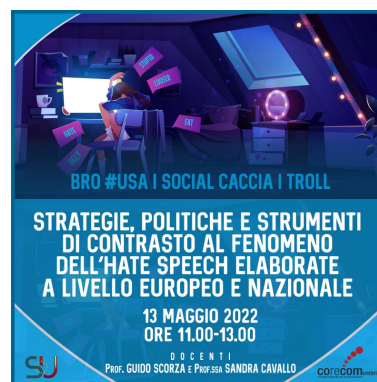
Figura 5: "Strategie politiche e strumenti di contrasto al fenomeno dell'Hate speech elaborate a livello europeo e nazionale"