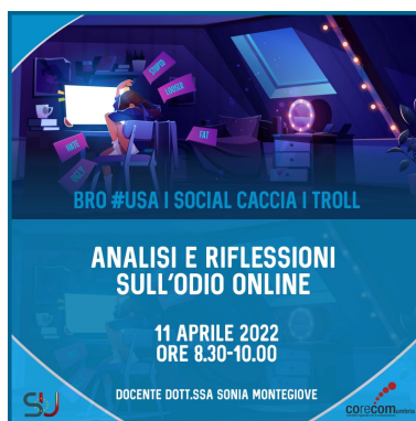
Figura 4: "Analisi e riflessioni sull'odio online"